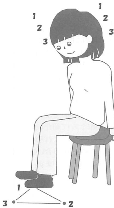
図1b 足の3点ステップテスト